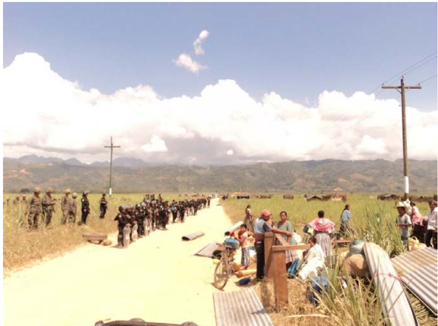
Miralvalle, Valle de Polochic, Guatemala, 15 de marzo de 2011. La comunidad fue expulsada, y sus casas y cultivos destruidos.

La nueva oleada de acuerdos sobre tierras no es la inversión en agricultura que millones de personas esperaban. Las personas más pobres son quienes más sufren cuando se intensifica la competencia por la tierra. Las investigaciones de Oxfam demuestran que la población local suele salir perdiendo frente a las élites locales y a los inversores nacionales o extranjeros, ya que carece de poder para hacer valer sus derechos y defender sus intereses eficazmente. Las empresas y los gobiernos deben adoptar urgentemente medidas para que se respete el derecho a la tierra de las personas que viven en la pobreza. Además, si se espera que las inversiones contribuyan a mejorar la seguridad alimentaria y los medios de subsistencia de las personas en lugar de minarlos, las relaciones de poder entre los inversores y las comunidades locales tienen que cambiar.